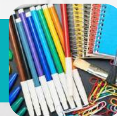
Канцтовары (тетради, ручки)