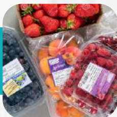
Фрукты в упаковке