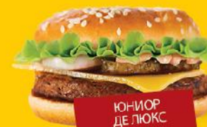
ЮНИОР ДЕ ЛЮКС