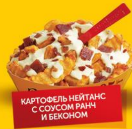
КАРТОФЕЛЬ НЕЙТАНС С СОУСОМ РАНЧ И БЕКОНОМ