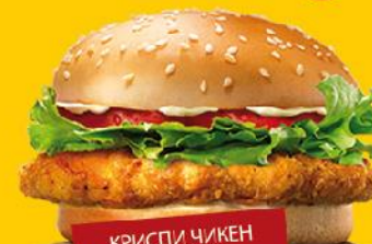
КРИСПИ ЧИКЕН ДЕ ЛЮКС