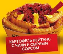
КАРТОФЕЛЬ НЕЙТАНС С ЧИЛИ И СЫРНЫМ СОУСОМ