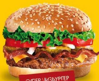
СУПЕР ЧИЗБУРГЕР С БЕКОНОМ