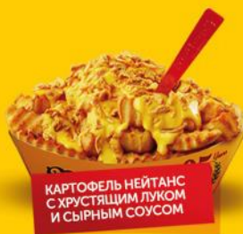
КАРТОФЕЛЬ НЕЙТАНС С ХРУСТЯЩИМ ЛУКОМ И СЫРНЫМ СОУСОМ