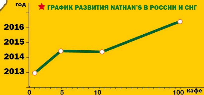
★ ГРАФИК РАЗВИТИЯ NATHAN'S В РОССИИ И СНГ

... и бренд готов к масштабному запуску на территории России и СНГ!