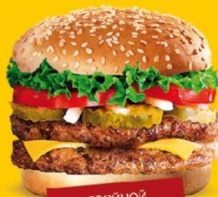
ДВОЙНОЙ СУПЕР ЧИЗБУРГЕР