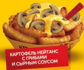
КАРТОФЕЛЬ НЕЙТАНС С ГРИБАМИ И СЫРНЫМ СОУСОМ