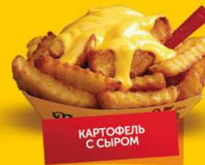
КАРТОФЕЛЬ С СЫРОМ